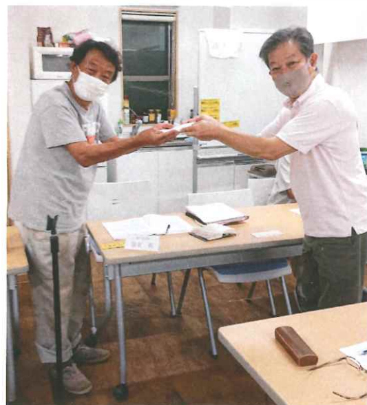
激励 いただきました

秋の拡大月間が始まりました。この秋の行動は、新型コロナウイルス感染症拡大第5波の中での取り組みとなりませんが、組合員・未加入者に寄り添うことを考え「今やるべきこと」「今やらなければならぬこと」「今やれること」と、「コロナを正しく恐れながら」と及び腰になるのではなく、行動に移す月間にしましょう。 コロナ禍で行動するべきではない等の意見も聞きますが、仲間や未加入者が経済的にも精神的にも苦しんでいるコロナ禍だからこそ組合の出番、行動に制限はあったとしても、拡大運動は大事です。