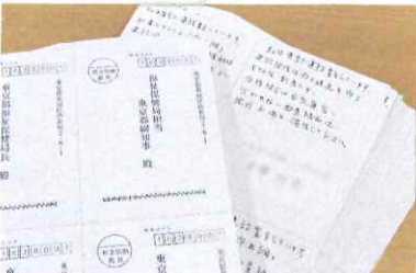
思い伝わる手書きのハガキ