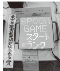
ゲーム (組込みシステム)

上製本・ノート、草履・ランチョンマット・コースター等草製品、畳縁の小物入れ、バケツ・水差し、表装道具・小物、貴金属、手彫りゴム印、銀行印・認印の注文製作、朱肉などのはんこグッズ、婦人服(ジャケット・ワンピース・スカート・ブラウス・コートその他小物)、ネクタイ・ベルト、和装技術科生徒作品、木工・木製家具(花台・腰掛・小引出・ローボード等)他