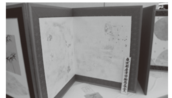
屏風 (表具) (前回の訓練生最優秀作品)