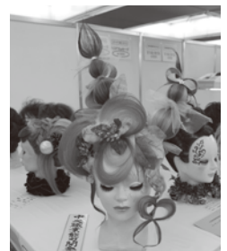
パーティーアップヘア (美容)