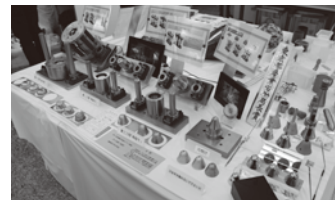
プレス金型 (機械加工) (前回の訓練生最優秀作品)

着物(振袖・創作帯等)、建築大工、製本(和綴製本)、畳、板金(水差し等)、表具(屏風・掛け軸等)、美容(ヘアスタイル)、貴金属、印章彫刻(はんこ)、洋裁(ドレス、婦人服)、洋服(紳士服)、木工塗装、調理(季節の日本料理と剥き物)、印刷(カレンダー)、和装、自動車整備、サイン・ディスプレイ、機械加工、電気工事、CAD(機械・建築・3D)、金属加工、広告美術、板金溶接、ゲーム機、塗装、木工、アパレルボタンナー、溶接、メカトロニクス、製くつ、デザイン塗装、1/10サイズモデルカー、制御盤、精密加工、機械組立、組込みシステム、電気・通信工事、製パン他